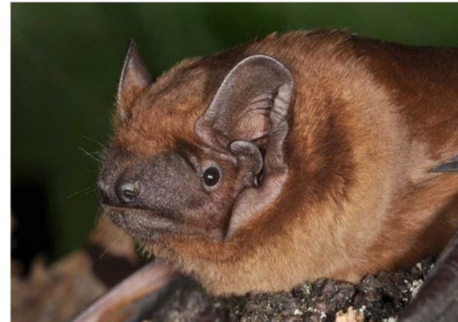
Großes Abendsegler