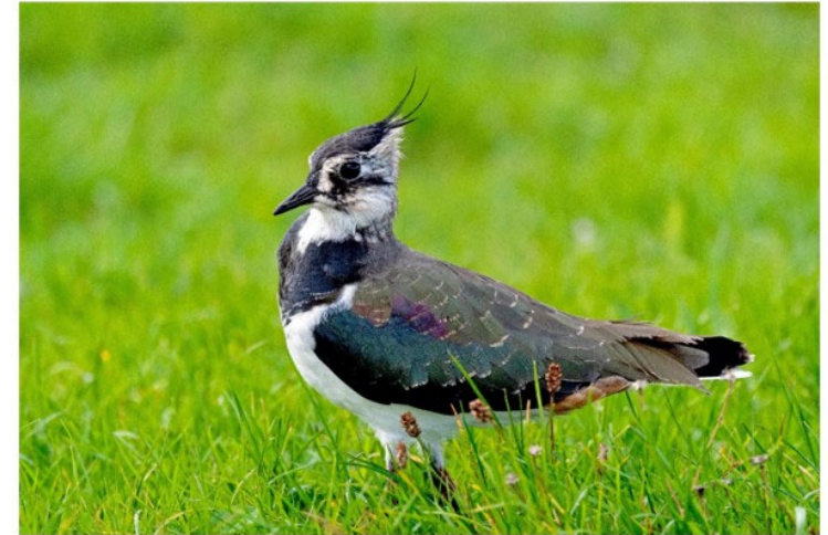
Kiebitz, Vogel des Jahres 2024

Der Kiebitz, Vogel des Jahres 2024, war noch vor 50 Jahren häufig auf den Feldern und Wiesen zu sehen. Zwischenzeitlich ist er aus vielen Landschaften verschwunden und gilt als „stark gefährdet“. Zwischen 1992 und 2016 betrug der Rückgang in Deutschland 88 Prozent! Eine der wenigen Vorkommen gibt es auch im Neckartal, in der Nähe der Hirschauer Seen, wohin wir zu einer Vogelbeobachtung einladen. Ob ein Kiebitz dabei ist, können wir nicht versprechen, aber im letzten Jahr waren auf unserer Beobachtungsliste über 40 Vogelarten.