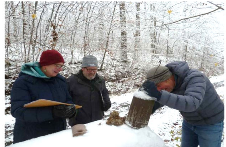
Kontrolle am 02.12.2023

Jedes mal aufs Neue eine interessante und verbindende Tätigkeit. Helfer, aber auch einfach nur Neugierige, die etwa 2 Stunden Zeit haben, sind herzlich willkommen.