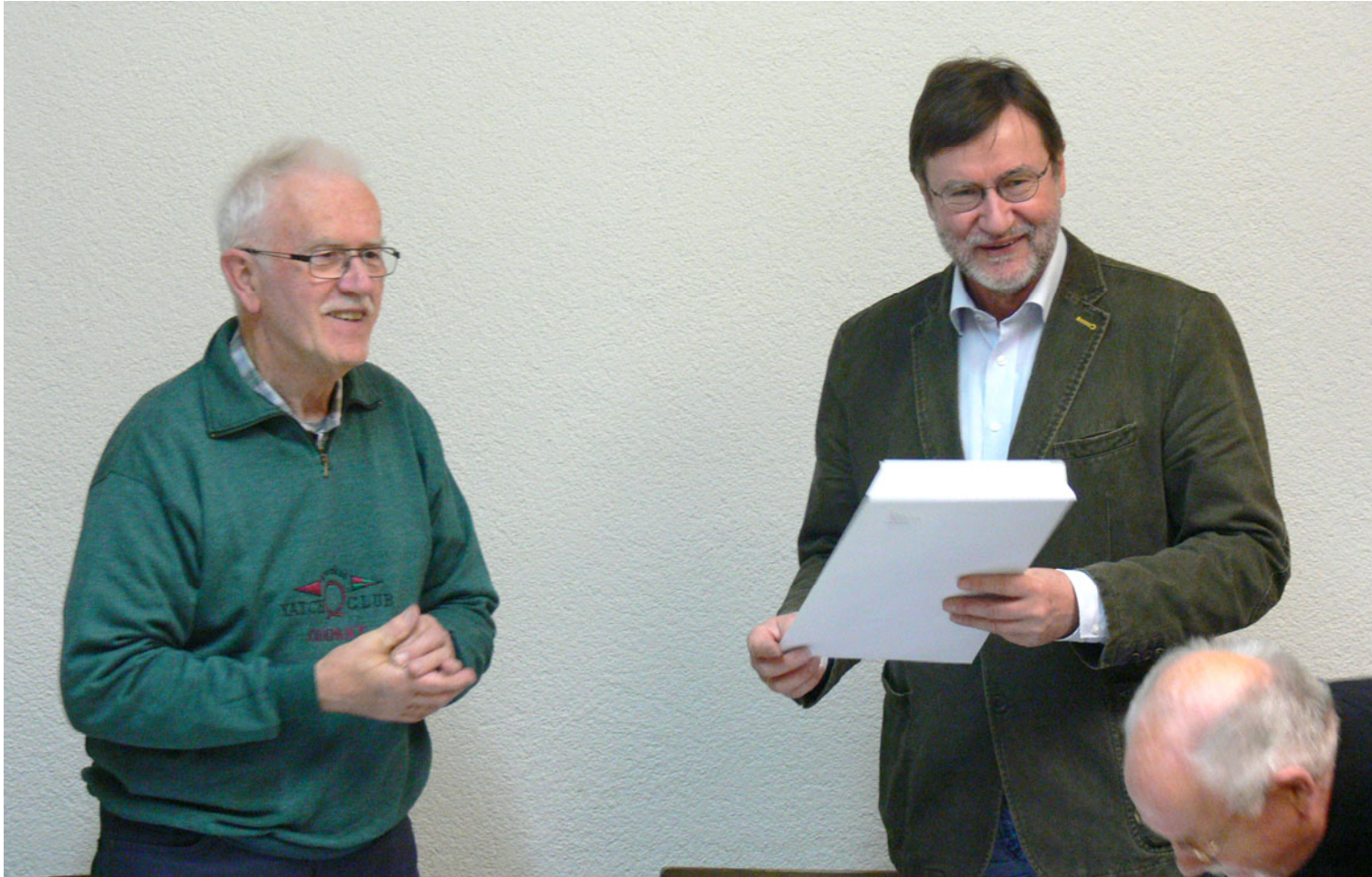
Jahreshauptversammlung 2016 – Wahl zum Stellvertreter und Schriftführer