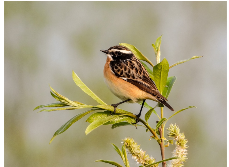
Braunkelchen Vogel des Jahres 2023

Jetzt im Frühling sind viele Vögel aus ihren Winterquartieren zurück. Andere sind auf dem Weg weiter in den Norden und machen bei uns Rast. Deshalb ist es ein günstiger Zeitpunkt, Arten zu beobachten, die sonst bei uns nicht anzutreffen sind. Die Seen, der Neckar und die Wiesen bei Hirschau sind dafür besonders erfolgversprechend.