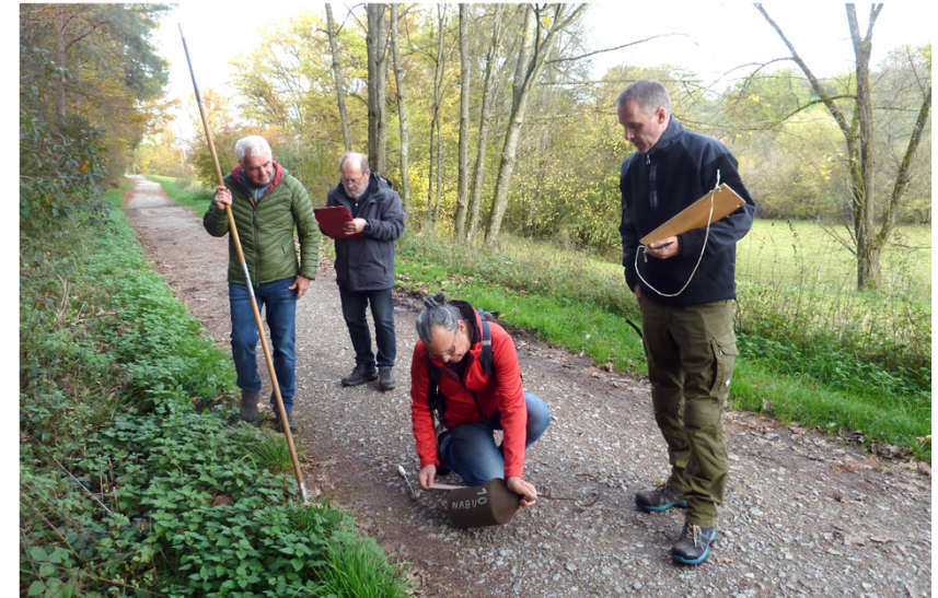
Kontrolle am 12.11.2022

Jedes Mal aufs Neue eine interessante und verbindende Tätigkeit. Helfer, aber auch einfach nur Neugierige, die etwa 2 Stunden Zeit haben, sind herzlich willkommen.