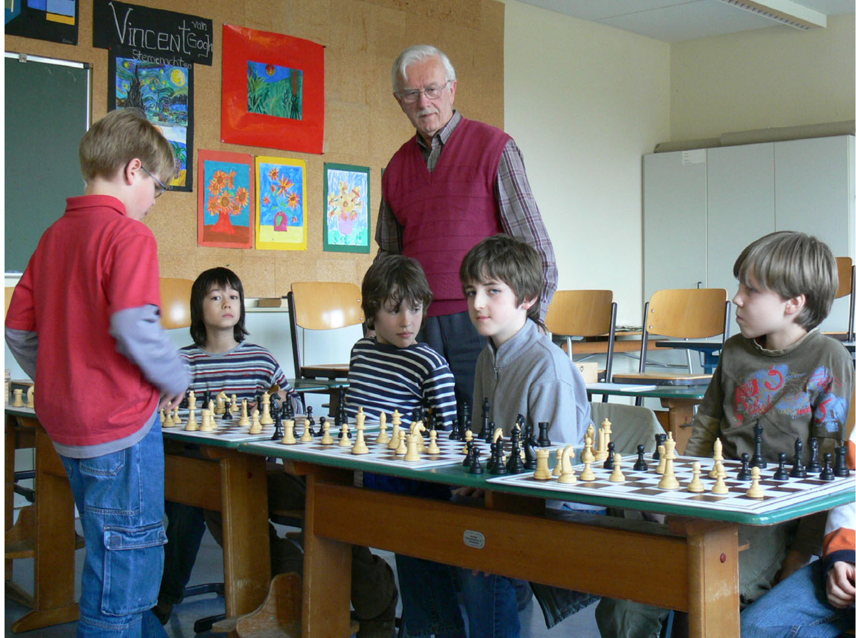
Schach und Umwelt 2007 - 2011