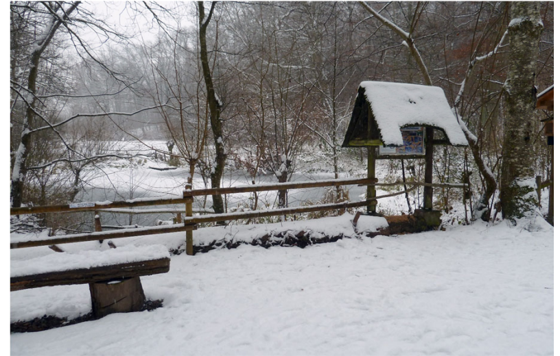
17.01.2021 Bachwiesen

Wir laden herzlich ein zu einer gemütlichen Wanderung in die Umgebung von Wannweil. Vom Bahnhof laufen wir am Kleintierzüchterheim vorbei zum Teich Bachwiesen, über Jettenburg und den Jägerplatz zurück zum Bahnhof Wannweil. Im Anschluss gibt es noch die Möglichkeit zum gemütlichen Zusammensein beim Grillen und Glühwein trinken. Bitte Grillgut selber mitbringen.