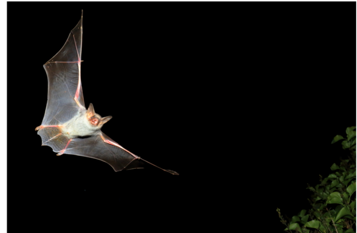
Großes Mausohr

Und was können wir tun, um ihre Lebensbedingungen zu verbessern?