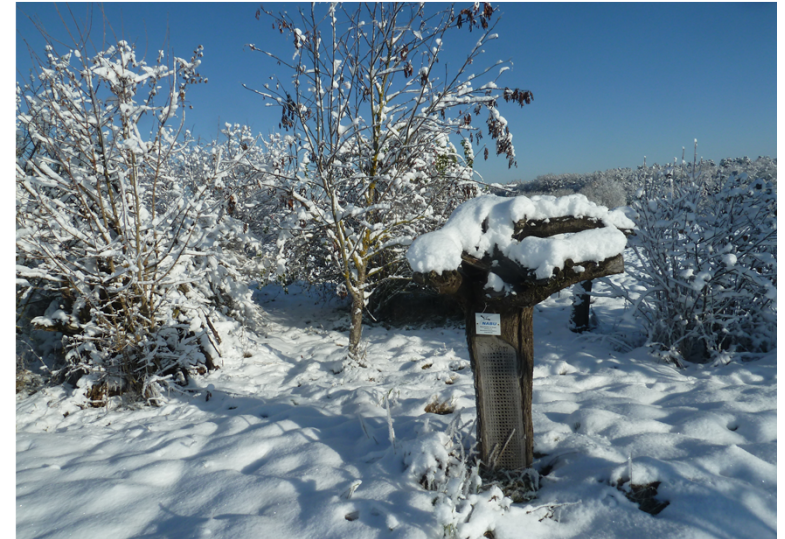
03.12.2023 Greuthecke

Wir laden herzlich ein zu einer gemütlichen Wanderung in die Umgebung von Wannweil. Vom Bahnhof laufen wir über die Firsthalde zum Betzinger Schützenhaus weiter zur Greuthecke und zurück zum Bahnhof Wannweil. Im Anschluss gibt es noch die Möglichkeit zum gemütlichen Zusammensein beim Grillen und Glühwein trinken. Bitte Grillgut selber mitbringen.